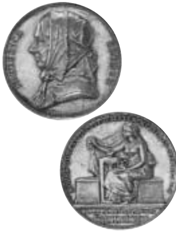
14. Fredrika Bremer av Adolf Lindberg. Silver, 31 mm. KMK 101 189.

Vissa reformer genomfördes under 1800-talets senare hälft, som t.ex. 1845 då lika arvsrätt infördes, 1846