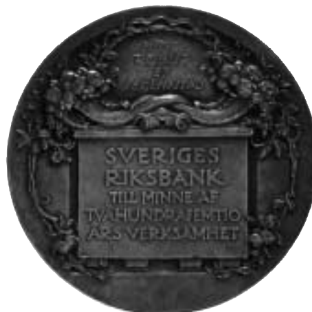
Riksbankens medalj 1918 till tvåhundrafemtioårsminnet av bankens grundande 1668. Utförd av Erik Lindberg.