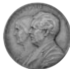
17. Anna Hierta-Retzjus av Erik Lindberg 1926. Silver. 31 mm. Utgiven av Kungl. Svenska Akademiens Hierta-Retzjus-stiftelse .