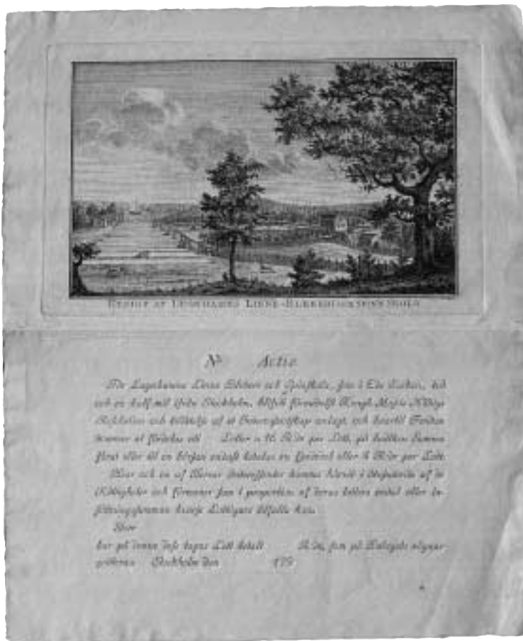
Lugnhamns Linne-Blekeri och Spinnskola. Ett av Sveriges vackraste aktiebrev med vinjetten graverad av Fredric Akrel 1797.

Till denna grupp av vackra och spännande värdepapper hör definitivt aktiebrevet som är kopplat till Lugnhamns Linne-Blekeri och Spinn-skola från 1797. Denna anläggning låg norr om Stäket vid en vik av Mälaren. På aktiebrevets vinjett ser vi själva blekeriet och spinneriet i bakgrunden. I stället har konstnären Fredric Akrel valt att visa fälten med lin, våder av linne utlagda på marken samt arbetande människor och fritt springande hundar. Längst bort, på bildens vänstra sida, syns ett segelfartyg som kanske kommit för att hämta en last med linne. De stora trä-