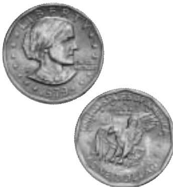
11. Susan Anthony på ett amerikanskt 1-dollarmynt från 1979.

Alva Vanderbilt Belmont började efter sin makes död 1908 engagera sig i kvinnosaksfrågan. Hon bjöd in