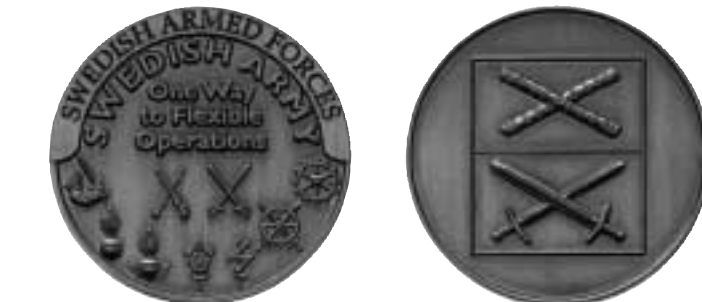
Medalj utgiven 2006 av den svenske arméinspektören (A I). Brons, diam. 40 mm. Tillverkad i Luleå (osignerad). H M Konungens samling.

Medaljens utformning har tagits fram vid arméavdelningen och inte av någon enskild konstnär. Man har använt fastställda symboler. Upplagan är enligt Almström "i princip obegränsad då vi beställer mer efter behov". Han säger också, att "texten