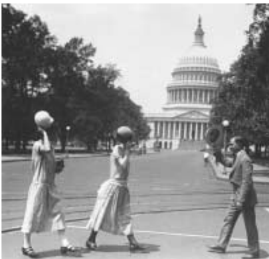
12. Två medlemmar av National Women's Party lyfter på hatten för jämställdheten, Washington DC 1925. Repro ur Beauty Queens. A playful History.