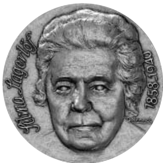
21. Selma Lagerlöf av Maurice Delannoy 1968. Brons, 68 mm. KMK 103 081.

Men kampen gick långsamt framåt och var starkt känsloladdad med många hätska utfall både från och mot kvinnor. Vid en landsomfattande petition 1913 fick man in 350 000