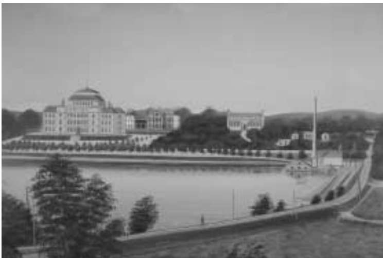
1. Växjö läroverk (t.v.) och Smålands museum (i mitten), färdigställda 1889 respektive 1885. Läroverket revs på 1960-talet för att ge plats för lasarettets utbyggnad. Smålands museum har byggts till i olika omgångar, senast 1996. Oljemålning från 1900-talets början. Okänd konstnär. Smålands museums samlingar.

Den 6 juni 1798 mottog ”Wexiö Kongl. Gymnasii Myntkabinett” en