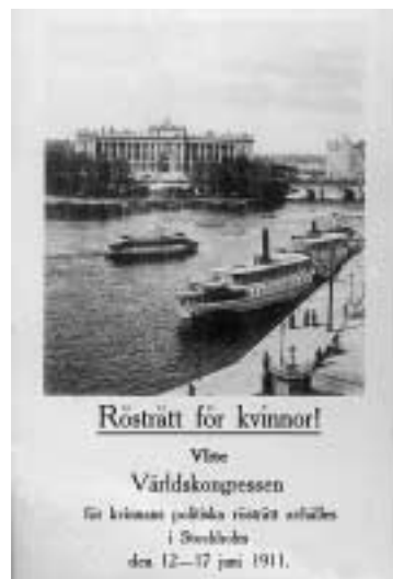
20. Vykort 1911 med uppmaning att ge kvinnor rösträtt. I fonden ses Riksdagshuset.

Elin Wägner (1882-1949) var journalist och författare som genom sina två första romaner Norrullsligan (1908) och Pennskaftet (1910) slog ett slag för rösträttsfrågan och kvinnornas självständighet i ett modernt samhälle. Hon deltog aktivt i kampen för kvinnlig rösträtt.