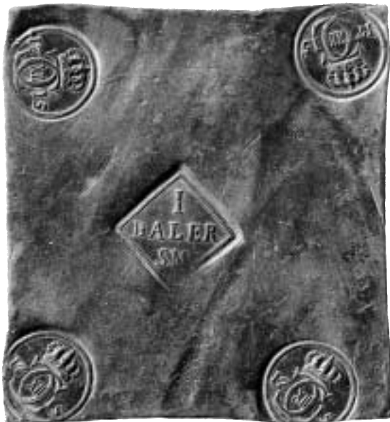
Karl XII, Avesta, 1 daler sm 1715. Sven Svenssons samling.

sökningen av provmynten till den blivande 10-dalern. För denna tillverkades tre provmynt redan 1640. Det största provmyntet hade valören 1½ daler sm, vilken valör med kursen 48 öre per riksdaler skulle ge just denna nominal till plåtmyntet. De båda andra skulle lyda å 1 respektive ½ daler. De var runda och existerar ännu idag i Kungl. Myntkabinetets ägo.