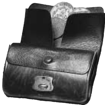
”Torgbörs” eller ”smålandspluska”. KMK.

Monnibox heter något som i reklamen kallas praktiskt. Med praktiskt menas att man kan pilla ned flera enkronor, tjugofemöringar, tioöringar, ettöringar i separata hål. Lika stor nytta sägs man ha av en grön, gul, blå eller röd liten tunna för 10-