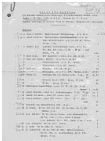
Fig. 3. Auktionslista nr 8a. Denna lista är, enligt författarnas åsikt, den mest sällsynta av alla SNF:s auktionslistor.