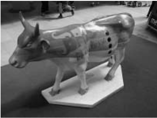
BRIS Kassakossa – hålen på magen avslöjar penganivåns höjd.