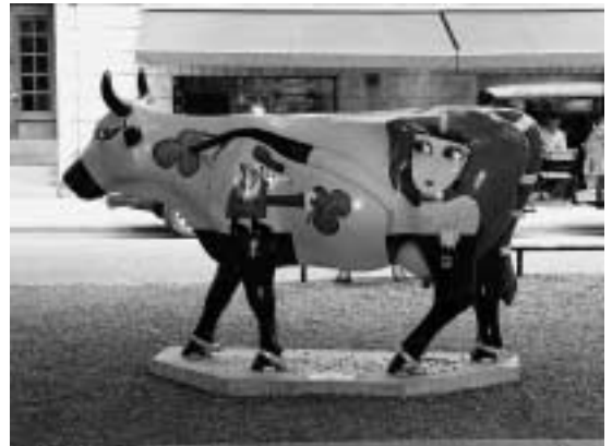
Mu-ta med klöver ko-mpis vid Katarina Bangata.

BRIS, Barnens Rätt I Samhället, hjälper barn vid t.ex. mobbing, sexualövergrepp, problem hemma, självmordstankar, misshandel och kulturkrockar. "Att stödja BRIS innebär att ta ett socialt humanitärt ansvar och vid ett samarbete dela och respektera BRIS grundläggande värderingar och följa BRIS policy för verksamheten."