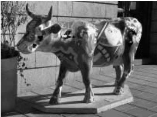
COWSINO utanför Casino Cosmopol. Se också omslagsbilden i färg.