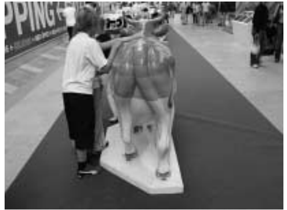
BRIS Kassakossa – passerande lägger mynt i myntspringan.