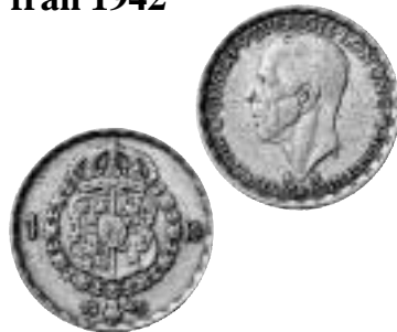
Den nya enkronan med sänkt silverinnehåll präglades under Gustav V mellan 1942-1950.

Fram till 1942 hade alla svenska enkronor varit präglade med ett silverinnehåll på 80%. Även under början av 1942 framställdes sådana mynt, men så kom en ny enkrona som också hade ett nytt utseende. Denna nya enkrona hade emellertid bara hälften så mycket silver som den gamla. Bakgrunden till sänkningen av silverhalten finner vi naturligtvis i det då pågående världskriget. Det var ett nödvändigt led i arbetet att få fram fler växelmynt. Myntets halt orsakades av den stora bristen på silver, vars värde stigit så mycket att det hade varit oansvarigt att låta silver ingå i mynten i samma utsträckning som tidigare. Enligt en lag, som trädde i kraft den 20 juli 1942, sänktes silvermängden till hälften. Det gamla myntet bestod som sagt till 80% av silver och till 20% av koppar. Den nya kronans sammansättning var däremot 40% silver, 50% koppar, 5% nickel och 5% zink. Vikten sänktes därmed från 7,5 till 7,0 g.