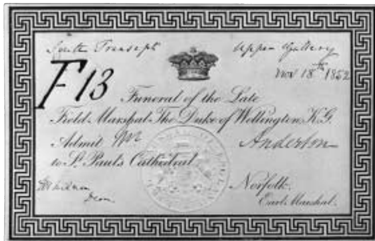
Inbjudningskort till hertigen av Wellingtons begravning 18 november 1852. Kortet har en rikt dekorerad klassisk ram. Till utseendet liknar det en sedel eller en papperspollett. Tryckt på endast en sida. Mätten är 182x117 mm. Privat ägo.