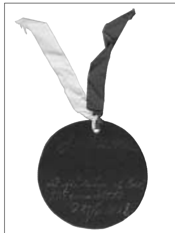
Tillståndsmärke av papp från invigningen av Karl XII:s staty 1868. På baksidan står utskrivet "Sångare". Troligen var det så att samtliga 700 sångare hade detta märke väl synligt på rockslaget. Skannat.

get, dels var det ett bra sätt för arrangörerna och vakterna att kunna se vilka som hörde ihop med kören. Det blev en form av kontrollmärke som visade att bäraren hade rätt att befinna sig innanför avspärningarna.