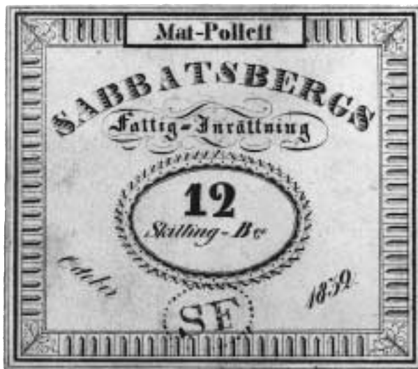
6. Matpollett av papp från Sabbatsbergs Fattiginrättning i Stockholm, 12 skilling banko, 1832.

Ovanstående lista ger den intresserade olika ingångar till det mycket omfattande pollettmaterialet, men det finns emellertid många fler artiklar i Svensk Numismatisk Tidskrift (leta i SNT:s register), Skandinavisk Numismatik , Mynttidningen och i Nordisk Numismatisk Unions Medlemsblad .