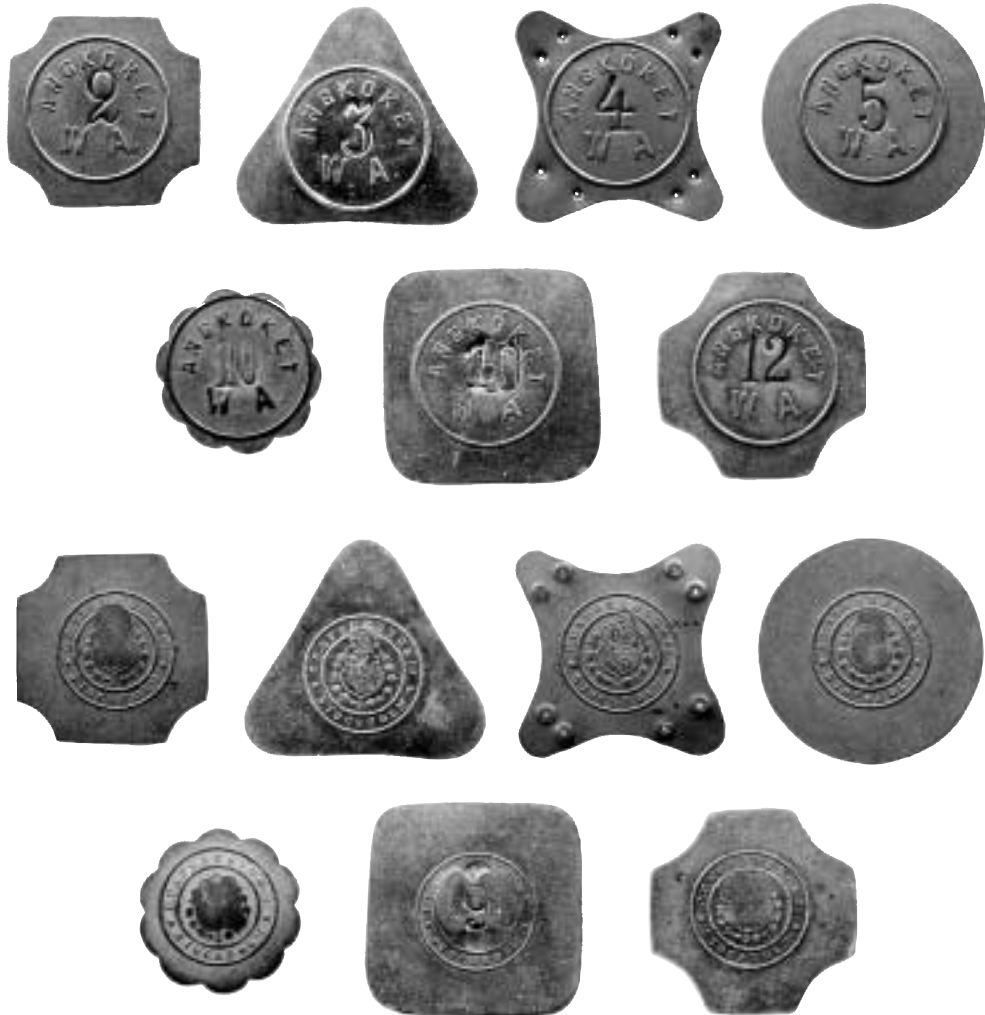
2a-b. Kopparpolletter med valörerna 2, 3, 4, 5 samt 10 och 12 av mässing med inskriften ÅNGKÖKET W. A. [Wiktor Aronsson]. På frånsidorna ses Sporrongs stämpel.