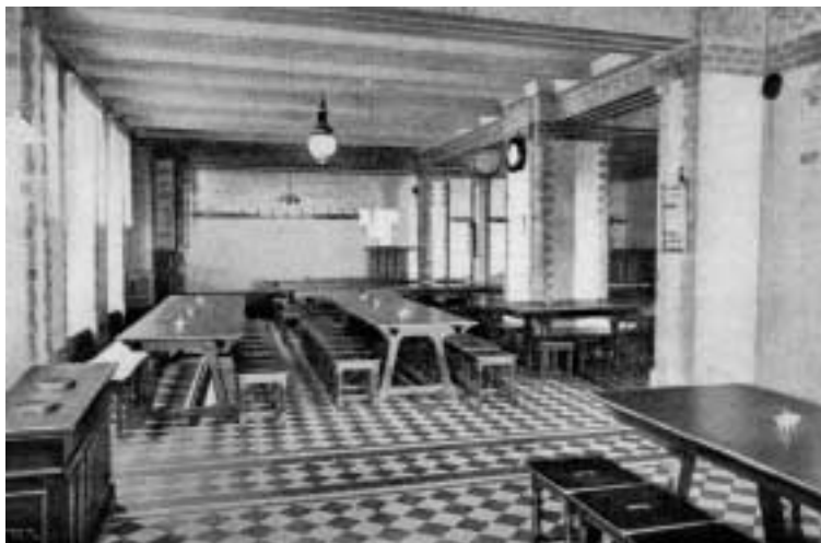
1. Ångköket, d.v.s. utskänkingsstället vid Skeppsbron i Göteborg. Foto: Ulf Ottosson liksom följande.